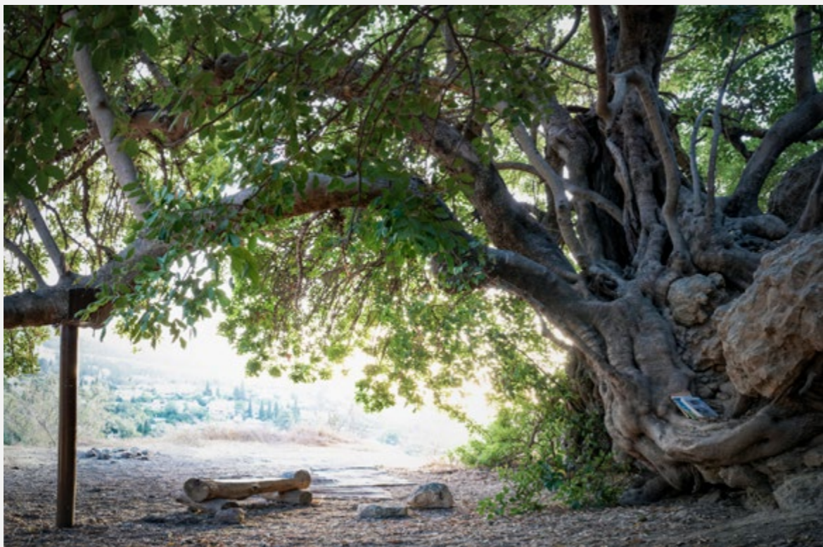
החרוב העתיק של עין כרם. קיץ 2022

המהונדס שכפה האדם על האדמה. בכל ביקור אני מזהה תנועה: נביטה חדשה, שיחי אלון שגדלו והשירו, שיח אחד שיבש לו, וכאן כבר רואים את תחילתו הממשית של עץ. לאחרונה ראיתי נביטות אלונים גם בגינות פרטיות ובתאי אדמה קטנים ברחבי שכונתי, בית הכרם. חברה סיפרה לי שמצאה בגינתה שלושה שיחי אלון מצוי שלא היא שתלה.