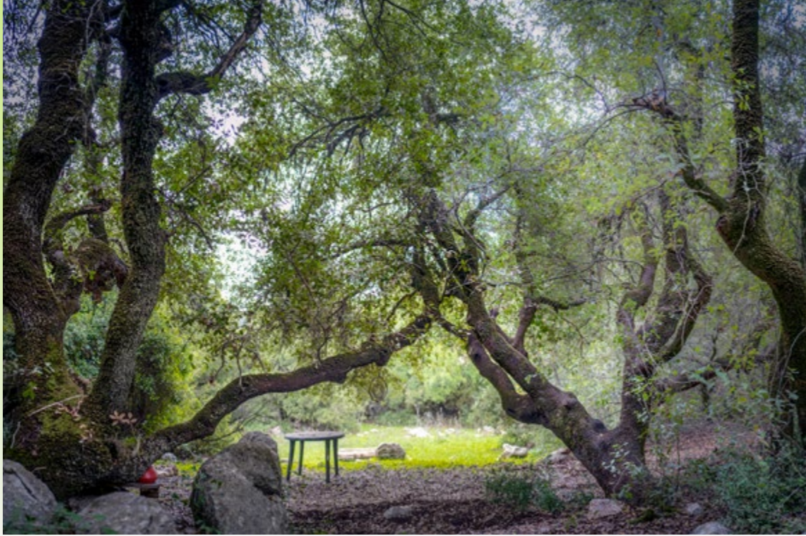
חדר ביער האלונים של ברעם. ינואר 2023

ביותר, ושפע רב מוצע לנו, אבל אנחנו נדרשים לנהלם בתבונה ובמידה; לא רק לקחת, אלא גם לתת: על כל הרס על האדם להציע תיקון; על כל עץ שנכרת עלינו לנטוע אחר במקומו ולשמר רבים אחרים; על כל שטח הנגזל מחיית בר עלינו לספק לה במקומו אחר שיאפשר לה להמשיך לחיות ברווחה ולהבטיח את המשכיותה.