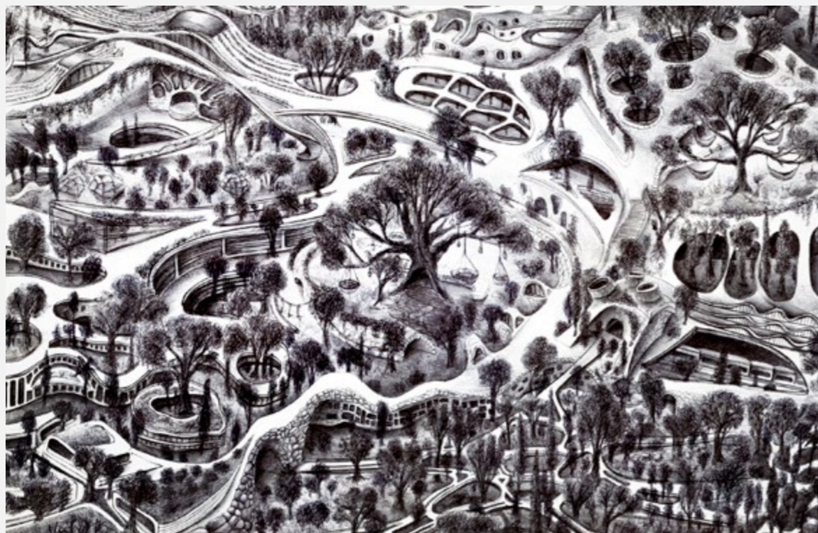
חזון תכנוני עתידי לאיחוד שטחים חשופים והרחבת שטחי אדמה בעזרת בנייה מעל לנתיבי תחבורה החפורים בקרקע. איור: אלינה באזל, פברואר 2023